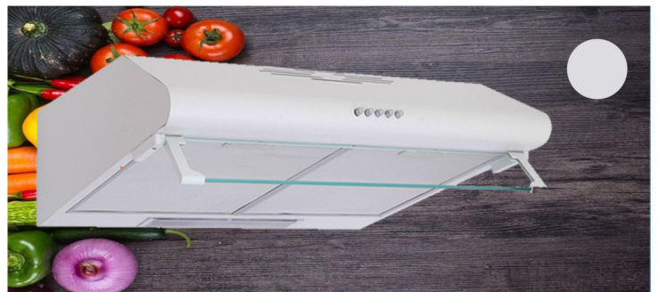
FMH 2090 X

Ελεύθερος Πλάτος 60 cm 450 m 3 / h Ενεργειακή κλάση D Ισχύς κινητήρα 2 x 90W Φωτισμός 1 x 5W Συνολική ισχύς 185W 2 μεταλλικά φίλτρα που πλένονται στο πλυντήριο πιάτων Επίπεδο θορύβου MIN: 55dB Επίπεδο θορύβου MAX: 63dB Έξοδος απορροφητήρα: 120 mm Ζαγρέ λευκό