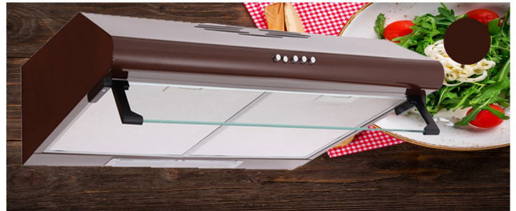
TMH 7590 X

Ελεύθερος Πλάτος 60 cm 450 m 3 / h Ενεργειακή κλάση D Ισχύς κινητήρα 2 x 90W Φωτισμός 1 x 5W Συνολική ισχύς 185W 2 μεταλλικά φίλτρα που πλένονται στο πλυντήριο πιάτων Επίπεδο θορύβου MIN: 55dB Επίπεδο θορύβου MAX: 63dB Έξοδος απορροφητήρα: 120 mm Καφέ